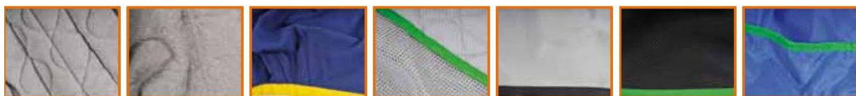
tissu éponge gros