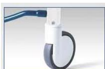
Roues diamètre 150 mm