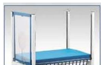
Pièces tête/pied amovibles (barres ou plexiglas)