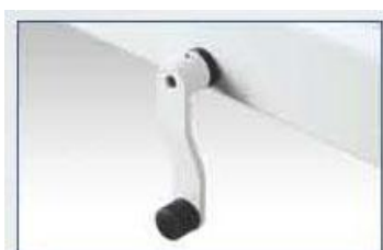
mécanisme à manivelle haut/bas Optionnel: électrique

Idéal pour le Sinne-bêdsje est l'adaptation haut/bas; dépendant de la longueur de l'infirmière ou le type de travaux qu'il/elle doit faire, le lit peut être adapté en haut ou en bas sans des interruptions. L'hauteur du sol de couchage puisse être adapté à l'aide d'un mécanisme à manivelle, ou encore plus facile, électroniquement, de 96 jusqu'à 76 cm, tandis que l'hauteur effective et la sécurité des rails latérales reste toujours le même. En longueur il y a deux modèles: 120 et 150 cm.