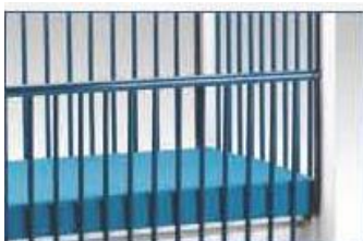
Barres latérales adaptable en 3 positions: haut, demi-haut et bas