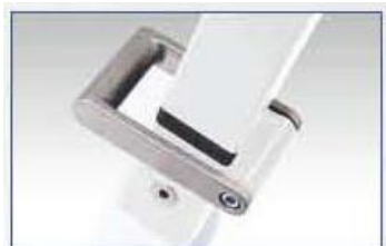
Manipulation barres latérales par pied