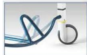
Support pied central pour bloquer les roues