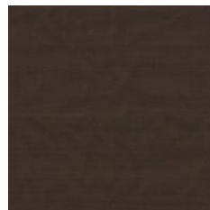
Aspect chêne wengé Réf. xx = 11