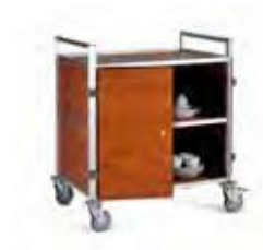
Cloisons et portes