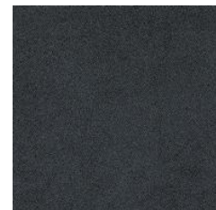
Aspect caviar Réf. xx = 14