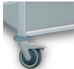
Frein sur 1 roue pivotable