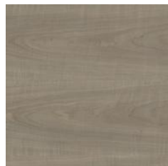
Aspect amandier Réf. xx = 17